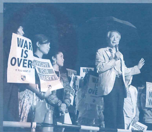
2015年6月19日国会前 2500人が集結したSEALDs主催の国会前集会で

井上ひさしとは仙台一高で同級、菅原文太は一年先輩で、彼らの晩年まで親交があった。『個人国家—今なぜ立憲主義か』（集英社新書）、『日本国憲法』をまっとうに議論するために（改定新版）（みすず書房）など著書多数。2016年3月出版の『「憲法改正」の真実』（集英社新書）では小林節氏との対談で、今ここにある危機を分かりやすく解説している。